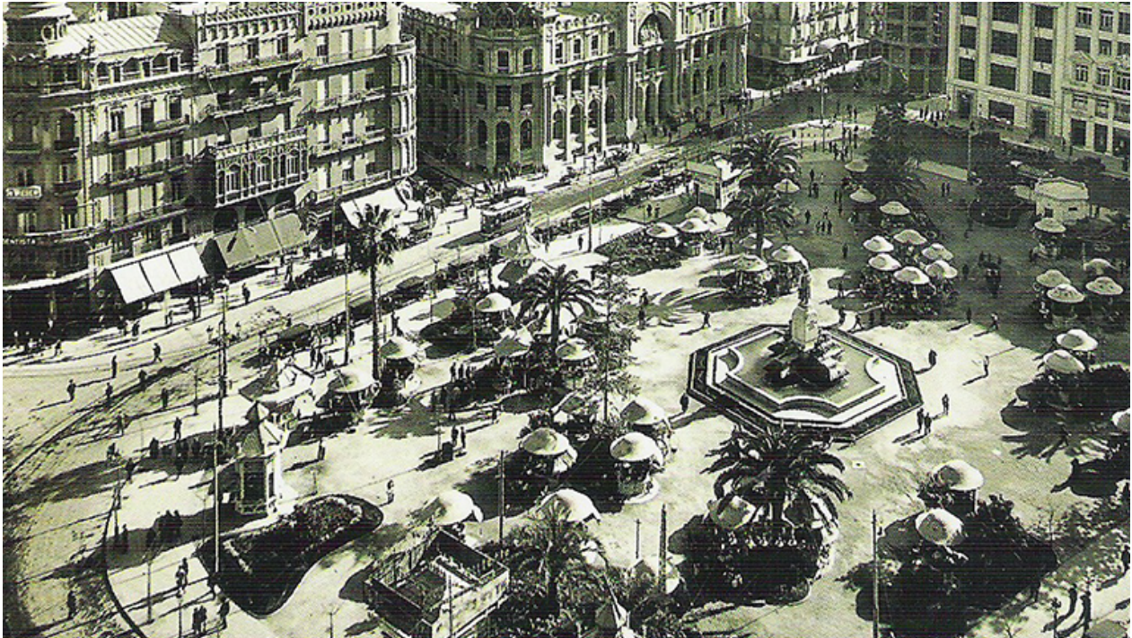
Figure 1: “Plaza de la Reina”

<img src="../../../pr.jpg" alt="Plaza con una fuente en el centro alrdeor casetas y fincas">